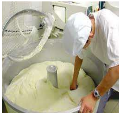
Boulangier - Pâtissier