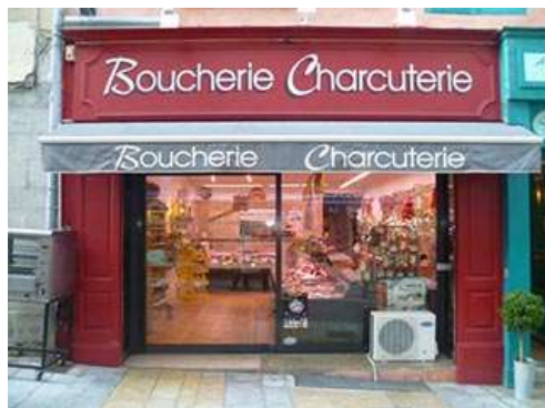
Boucherie - Charcuterie