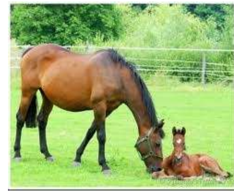
Métiers du cheval