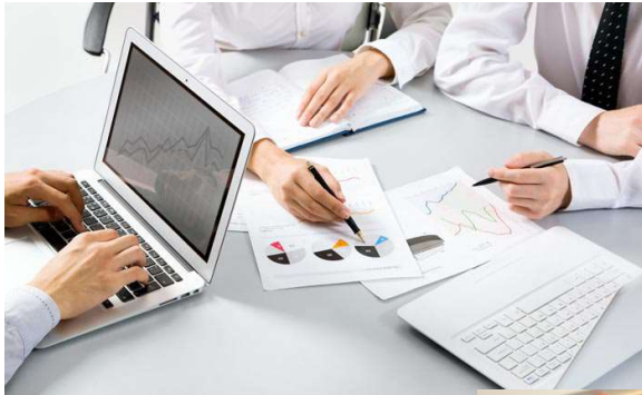
Les formations du Lycée Les Huisselets - Métiers du tertiaire