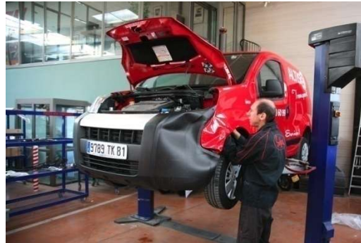
Mécanique véhicules industriels